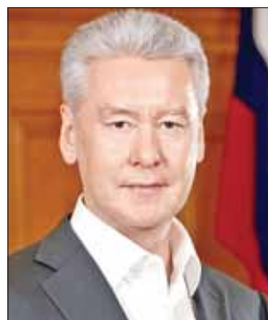
Сергей Собянин, Мэр Москвы:

«При проектировании комплекса предусмотрели все до